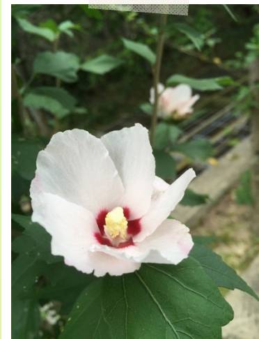
↑今年も芙蓉(ふよう)の花が美しく咲きました。

「奥池ロτζジ」は本来、大阪ガス様の社員研修を行うために 作られた施設で、一般のお客様はご利用頂けませんでした。 現在では大阪ガス様はもちろんですが、グループ会社様 一般のお客様にもご利用いただける施設となっております。